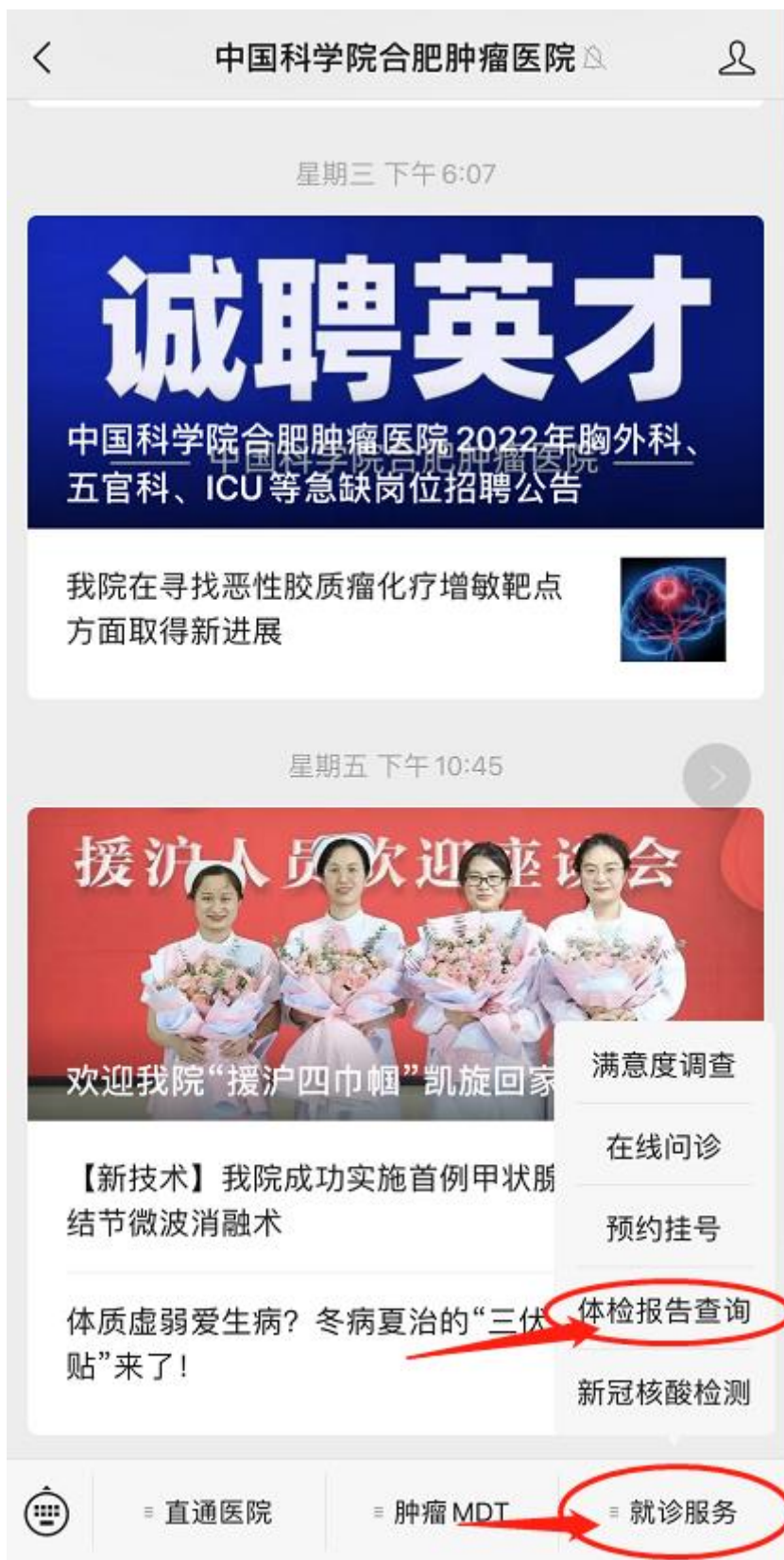
三、新用户首次登陆需要注册用户绑定，如下图：